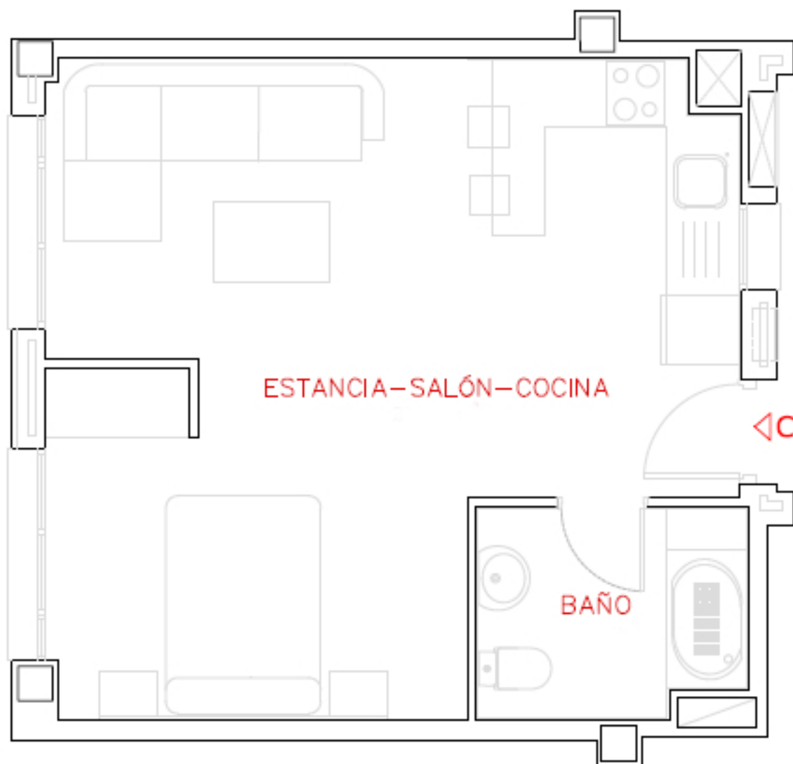
VIVIENDA C, PLANTA 4ª