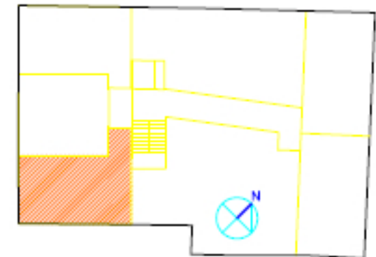
VIVIENDA B, PLANTA 3ª

LA INFORMACIÓN DEL PRESENTE PLANO ES ORIENTATIVA Y ESTÁ SUJETA A MODIFICACIONES DERIVADAS DEL PROYECTO DE EJECUCIÓN Y DE SU CONSTRUCCIÓN