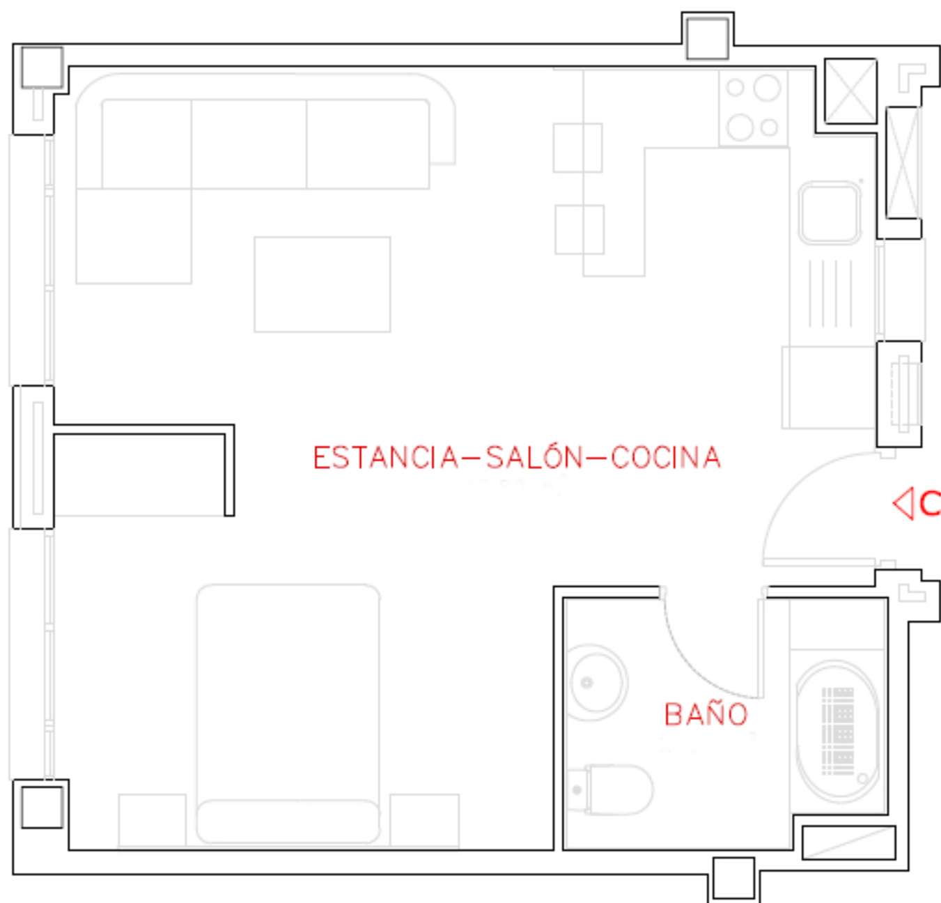
VIVIENDA C, PLANTA 2ª