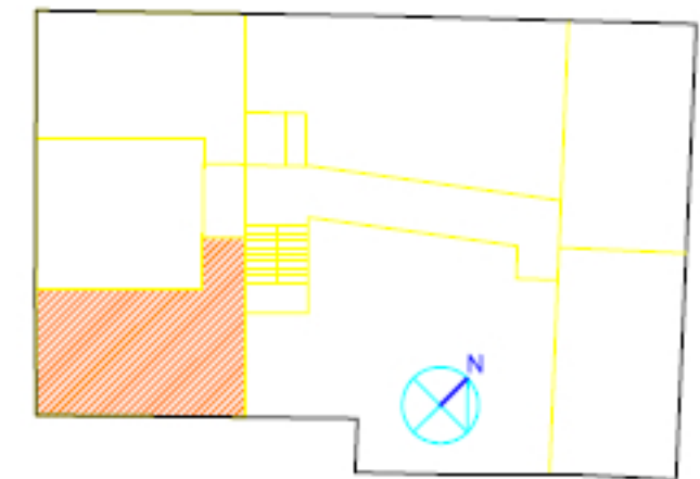
VIVIENDA B, PLANTA 1ª

LA INFORMACIÓN DEL PRESENTE PLANO ES ORIENTATIVA Y ESTÁ SUJETA A MODIFICACIONES DERIVADAS DEL PROYECTO DE EJECUCIÓN Y DE SU CONSTRUCCIÓN